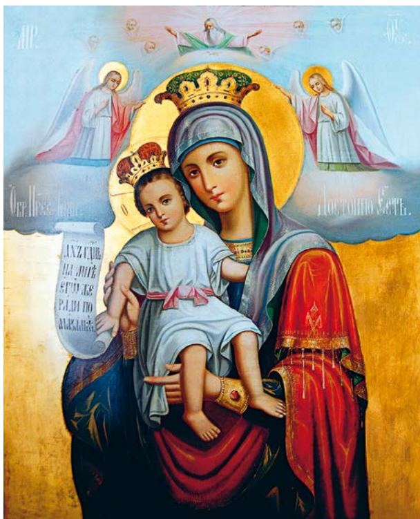
Икона Божией Матери «Достоинно есть»