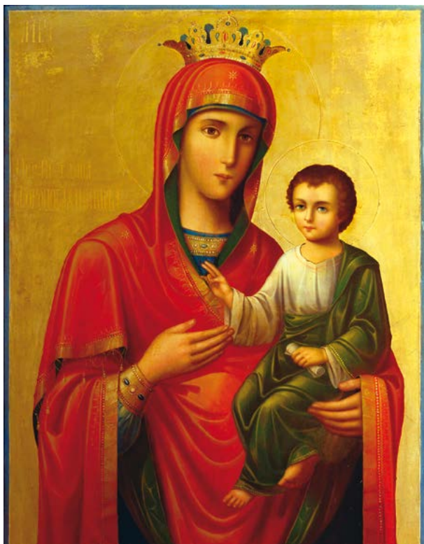
Икона Божией Матери «Скоропослушница»