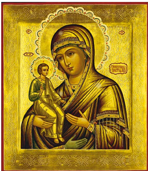
Икона Божией Матери «Троеручица»