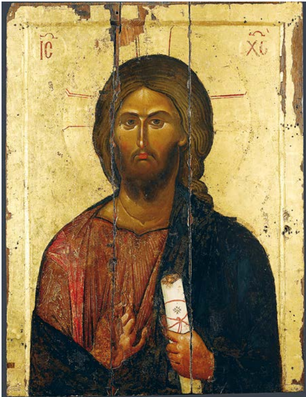
Икона Спасителя «Вседержитель»